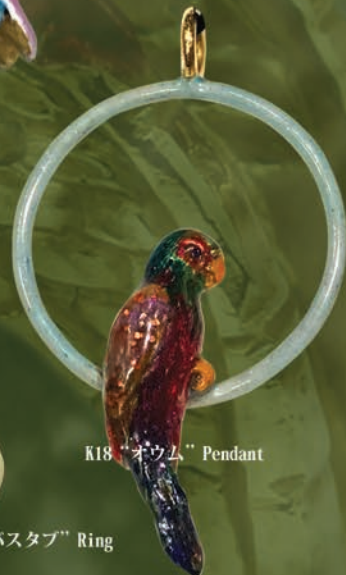
K18 “オウム” Pendant