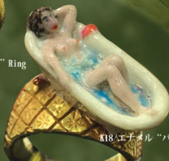
K18/エナメル “バスタブ” Ring