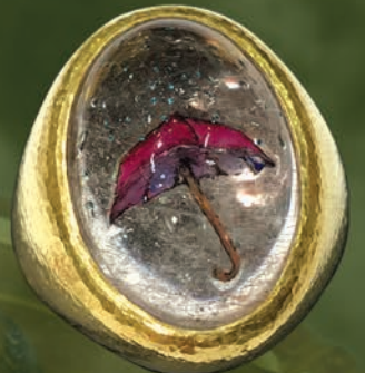
K18/エナメル “アンブレラ” Ring