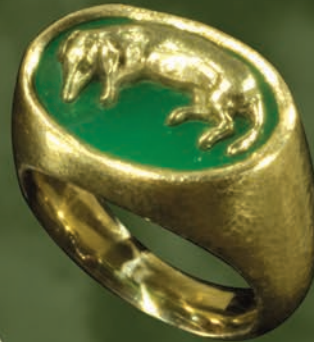
K18/エナメル “イヌ” Ring