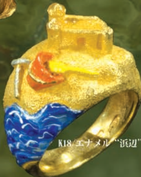
K18/エナメル “浜辺” Ring