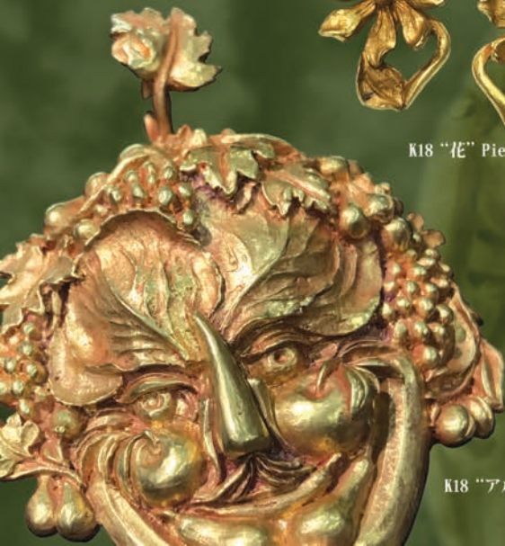
K18 “アルチンホルト” Pendant