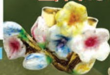
K18/エナメル “花” Pierce