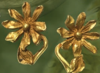
K18 “花” Pierce