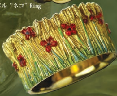
K18/エナメル “ボビー” Ring