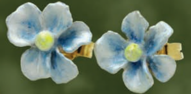
K18/エナメル “花” Pierce