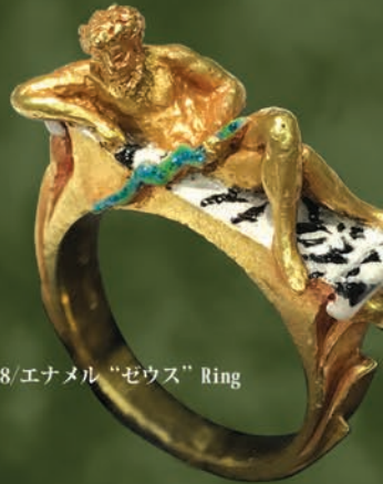
K18/エナメル “ゼウス” Ring