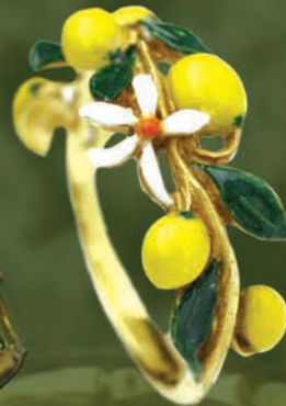
K18/エナメル “レモン” Ring