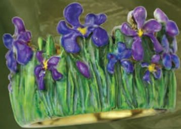
K18/エナメル “アイリス” Ring