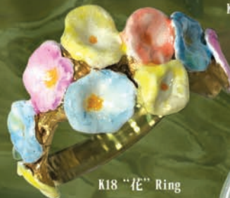
K18 “花” Ring