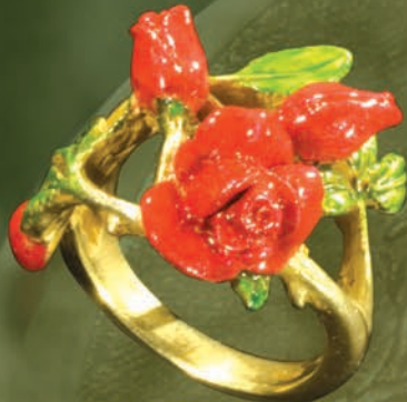
K18/エナメル “バラ” Ring